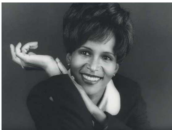
Direcció Artística: Ghislaine MAC